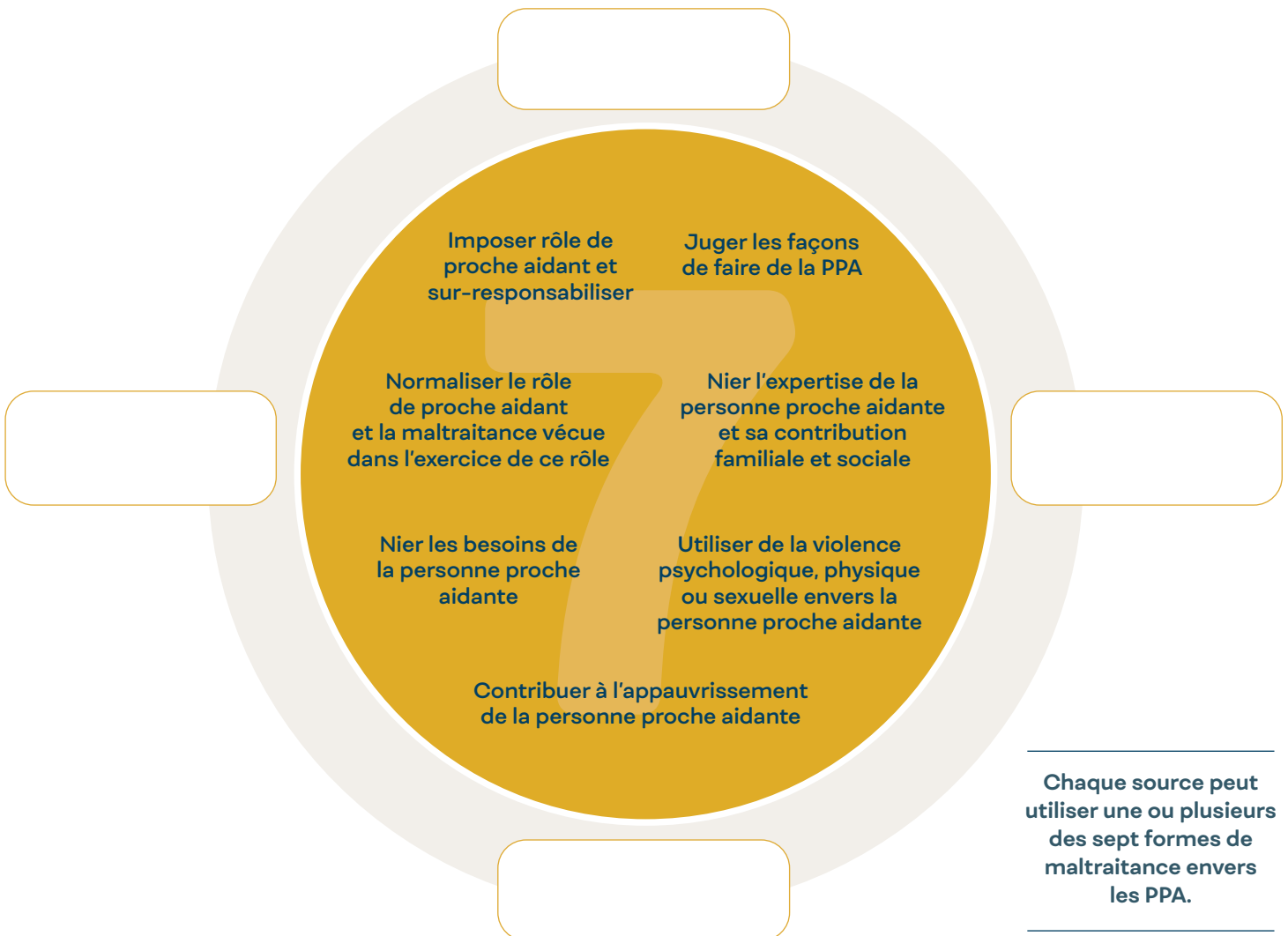
FIGURE 2 : Manifestations de la maltraitance envers les PPA et ses provenances.

La maltraitance envers les PPA peut prendre les sept formes suivantes :